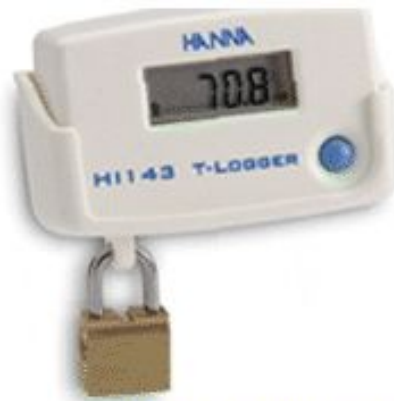
VD832 ENREGISTREUR DE TEMPERATURE -30° à +70°C SUPPORT MURALE CADENAS