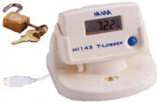
VD830 ENREGISTREUR DE TEMPERATURE -30° à +70°C TRANSMETTEUR DE DONNEES USB SUPPORT MURAL CADENAS