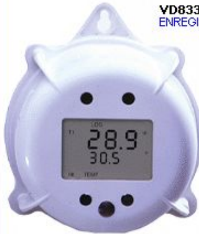
VD833 ENREGISTREUR DE TEMPERATURE -20° à +70°C