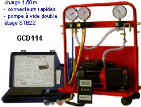
STATION DE CHARGE